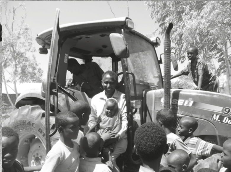
Salah insieme ai bambini somali

“ D eponi il fucile e prendi la matita” è lo slogan del gruppo di volontariato vincenziano italo somalo attivo dal 1994. Venti anni di lavoro in Italia (Piemonte), per reperire fondi, e in Somalia per creare pozzi e realizzare scuole. Oggi sono